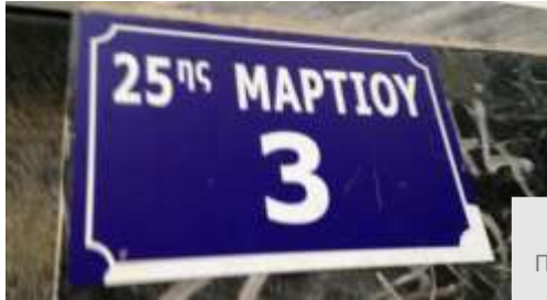
Πειραματικό Δημοτικό Σχολείο Φλώρινας