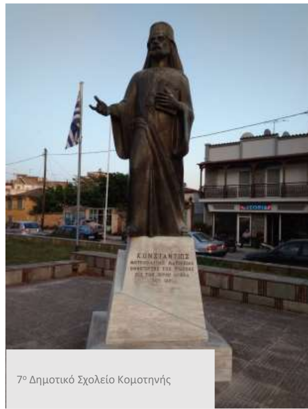
7ο Δημοτικό Σχολείο Κομοτηνής