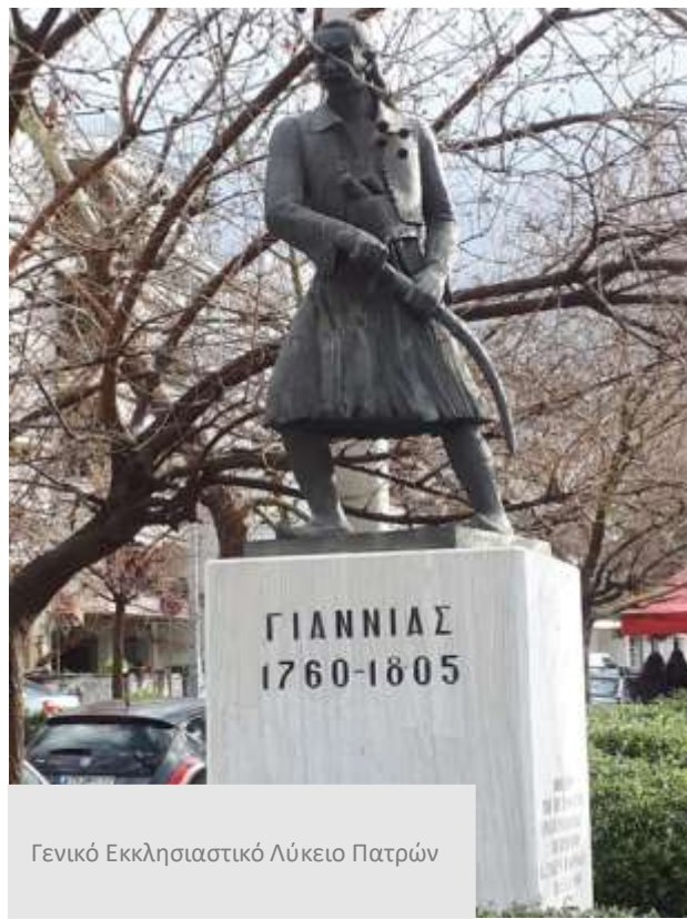
Γενικό Εκκλησιαστικό Λύκειο Πατρών