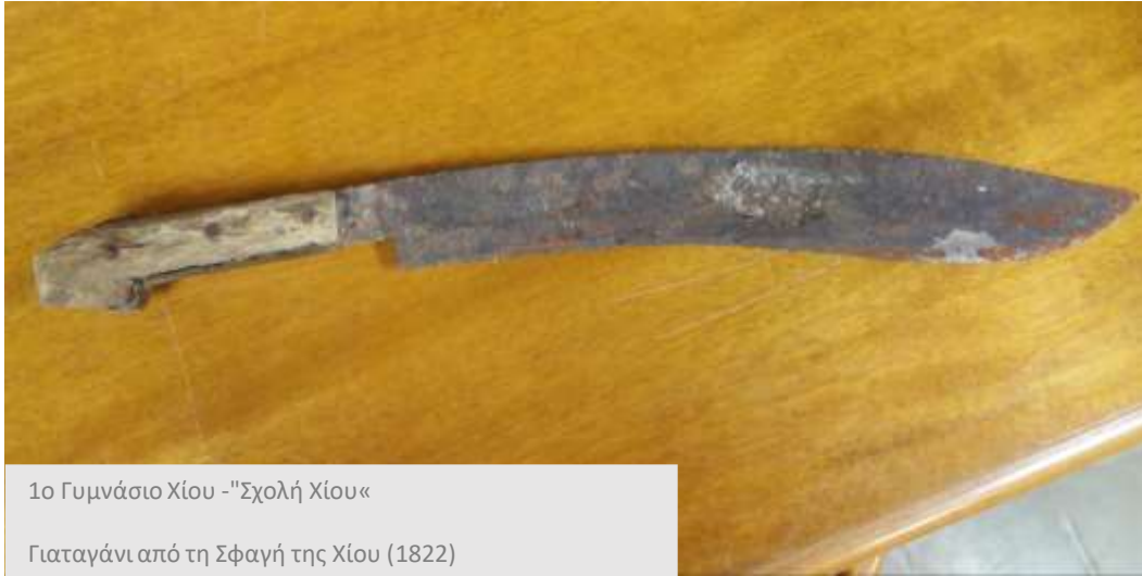
1ο Γυμνάσιο Χίου - "Σχολή Χίου" Γιαταγάνι από τη Σφαγή της Χίου (1822)